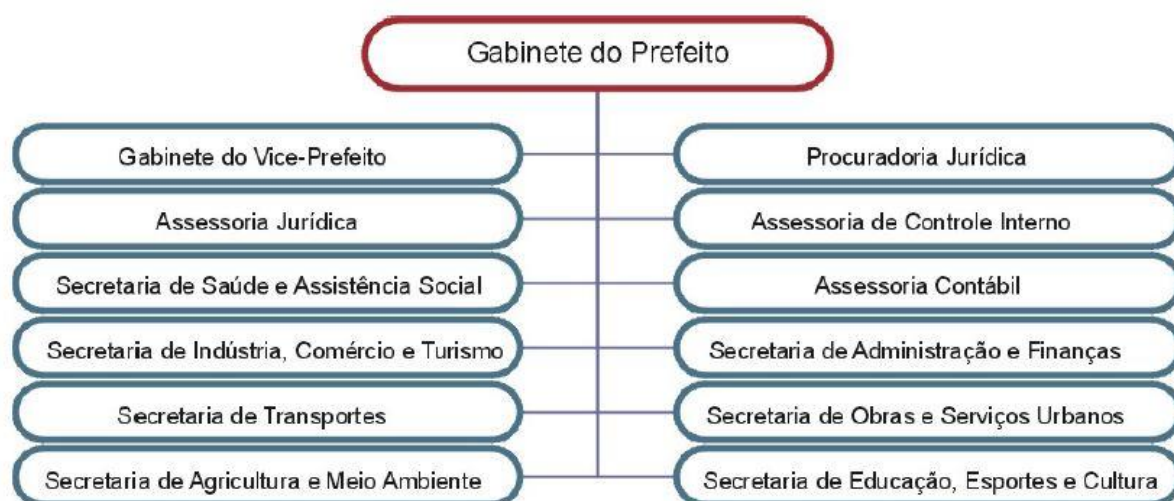
FIGURA 1: ORGANOGRAMA 2007

Na Leitura da Realidade relativa a elaboração do Plano Diretor de 2007, em vigor, foi levantado o organograma da figura FIGURA 1 a seguir. Nota-se que naquele período havia somente 7 Secretarias Municipais. Sendo que algumas agregavam diferentes funções em uma única secretaria, como a Secretaria de Obras e Serviços Urbanos.